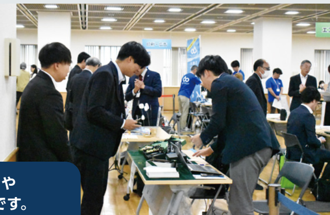
▲中央区ビジネス交流フェア2025の展示会の様子

当日は、展示・バイヤー商談に加え、出展者同士や来場者との交流を深めるプログラムも実施予定です。新たな出会いとつながりづくりの場としてご活用いただけます。