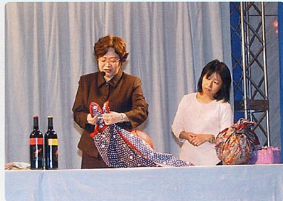
▲魔法の包装「ふるしき」の包み方実演

★各ブースに「体験コーナー」や「サービスコーナー」あり! ★スタンプラリー・クイズに参加して、景品をゲットしよう! ★特設ステージで、毎日いろいろな楽しいショーを開催!