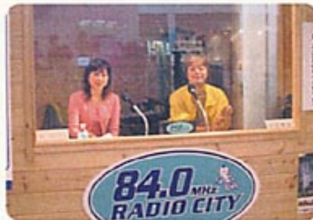
中央FMの実況放送中 ▶

中央区・中央区産業文化展実行委員会 ●お問い合わせ先/中央区役所庶務課 03-3546-5329~9 ホームページ/ http://www.chuo-kogyo.jp/