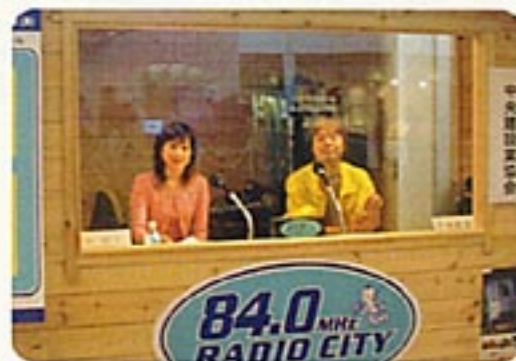
中央FMの実況放送中 ▶