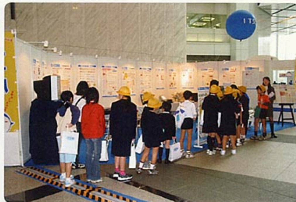
▲午前中、区内の城東、明石、佃島、有馬、月島第三、明正、月島第二など各小学校の皆さんがおおぜい見学に見えました。

★各ブースに「体験コーナー」や「サービス・コーナー」あり! ★スタンプラリー・クイズに参加して、景品をゲットしよう! ★特設ステージで、毎日いろいろな楽しいショーを開催!